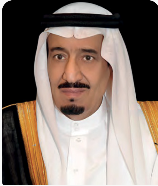
خادم الحرمين الشريفين الملك سلمان بن عبدالعزيز آل سعود